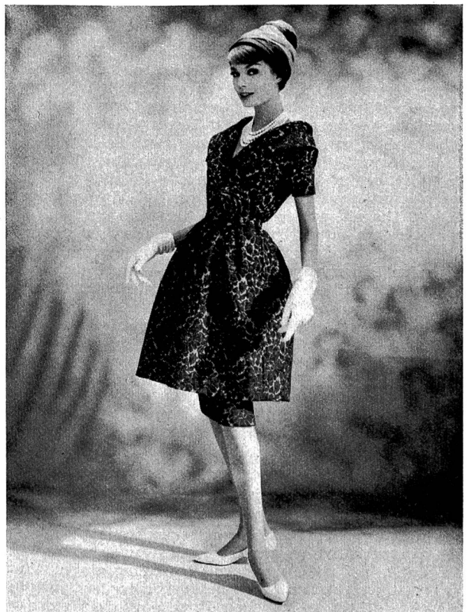
Stehli Seiden AG. Zürich Robe cocktail en fibranne viscosa, nylon et soie

Abgesehen von den bereits im Handel befindlichen Mischgeweben wurden verschiedene Neuheiten gezeigt, die in die Domäne des Fachmannes gehören.