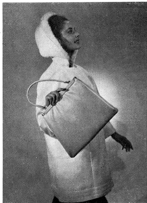
Elegante Après-Ski-Jacke aus «Skaiflor», dazu sportliche Bügeltasche aus dem gleichen Material

Immer ausgeprägter ist der Wunsch des modernen, reisefrohen Menschen nach praktischem Reisegepäck, stets assortierfähigen Handtaschen und neuerdings auch lederähnlicher Sport- und Reisebekleidung. Es galt etwas zu entwickeln, das die guten Eigenschaften der bisherigen Materialien aufwies, aber weniger kostspielig ist. Fachleute verfolgten dieses Ziel und entwickelten in verantwortungsbewußter Arbeit zuerst «Skai». Es erwies sich als widerstandsfähig, schmutzunempfindlich und gut abwaschbar. Außerdem ließ sich dieses neue Material in lichteichten