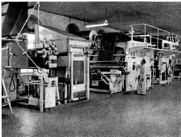
Schrumpfmaschine zur Behandlung von Geweben, damit diese als konfektionierte Ware nicht mehr eingehen.