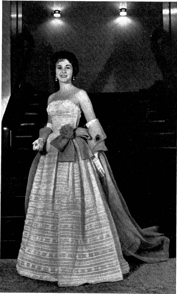
Die Baumwollkönigin in einer St.-Galler Stickerei-Abendrobe mit vier Stickereiarten