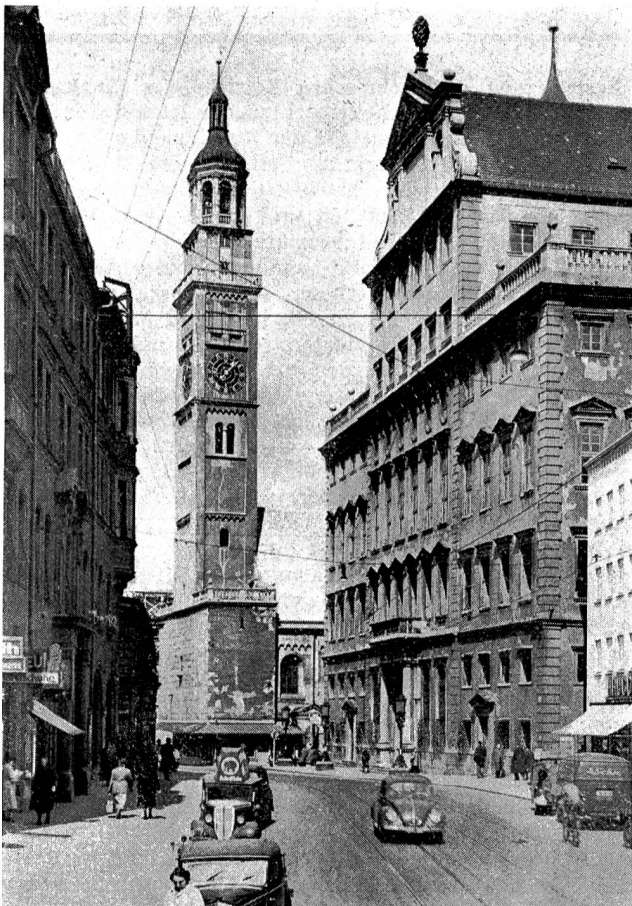
Augsburg: Carolinenstraße mit Perlachturm und Rathaus

Augsburg , eine Weltstadt des Mittelalters, ist eine der ältesten deutschen Städte. Ihr Gründer war der römische Kaiser Augustus. Seit altersher ist die Stadt ein Schnittpunkt wichtigster kontinentaler Verkehrsverbindungen, wodurch sie besonders im Mittelalter in hohem Ansehen stand. Die Bürger der alten Bischofsstadt erreichten im 13. Jahrhundert die Reichsfreiheit. Durch die geldmächtigen Fugger und die seefahrenden Welser erhielt Augs-