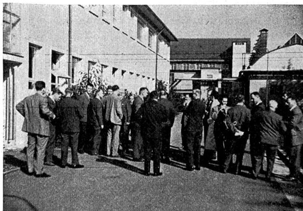
Beim Rundgang durch das Werk Neu-Bolheim der Woldeckenfabrik Zöppritz AG.