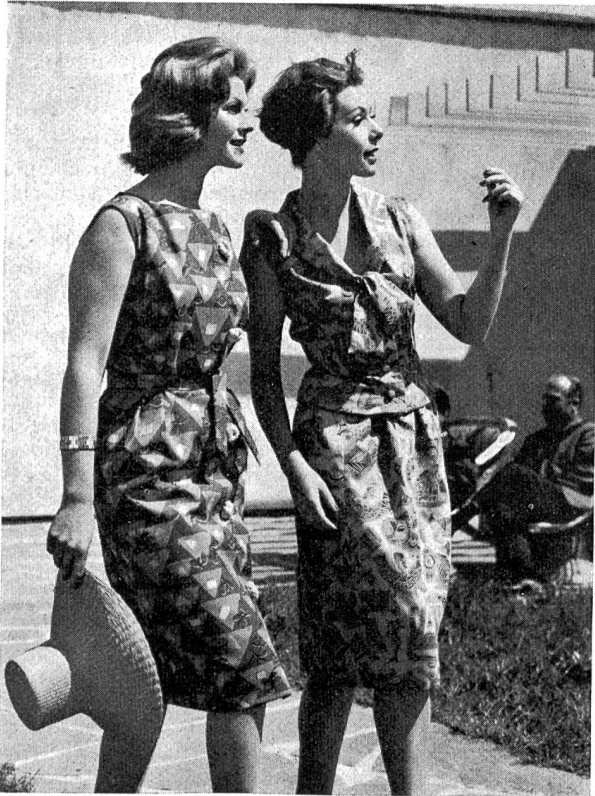
Ferienkleider; 100 % Baumwolle — Leinenstrukturgewebe von Franz M. Rhomberg, Dornbirn.

gen der Schweiz entspricht. Ihre Integrationsorgen tangieren die schweizerischen, wie auch viele weitere wirtschaftspolitischen Fragen. Diese Verbundenheit mag sich symbolisch in der historischen Begebenheit dokumentieren, daß der Freiheitsbrief der Stadt Feldkirch seit dem Jahr 1376 im Staatsarchiv der Stadt Zürich in Verwahrung ist, — «Zürich sei der sicherste Ort für dieses Dokument».