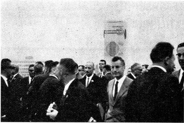
Eine Gruppe der VST-Reisegesellschaft auf dem Messegelände in Hannover

seine unübersehbare Ausdehnung einen gewaltigen Eindruck machte. Mehr als 750 Firmen, in alphabetischer Reihenfolge, aus Belgien, Dänemark, der Deutschen Bundesrepublik, Frankreich, Großbritannien, Italien, Japan, Jugoslawien, den Niederlanden, Oesterreich, Portugal, Schweden, der Schweiz und den USA stellten Textilmaschinen, Zubehörartikel, Maschinen für die Bekleidungsindustrie sowie Prüfapparate aus. Durch diese Vielseitigkeit vermittelte die sehr interessante Schau jedem Besucher einen umfassenden Ueberblick über den neuesten Stand und die Leistungsfähigkeit der internationalen Textilmaschinenindustrie. Die schweizerische Textilmaschinenindustrie war durch ihre große Beteiligung und durch ihre qualitativ hochwertigen Erzeugnisse sehr gut vertreten. Neben den sehr zahlreichen Ausstellern aus der Bundesrepublik traten die Italiener stark in Erscheinung und überragten mit ihren vielseitigen Angeboten die anderen Länder merklich. Zehn Hallen, numeriert von 1—4, 4a und 5—9, standen für diese bisher größte Textilmaschinen-schau zur Verfügung. Sie gliederte sich in folgende Gruppen: