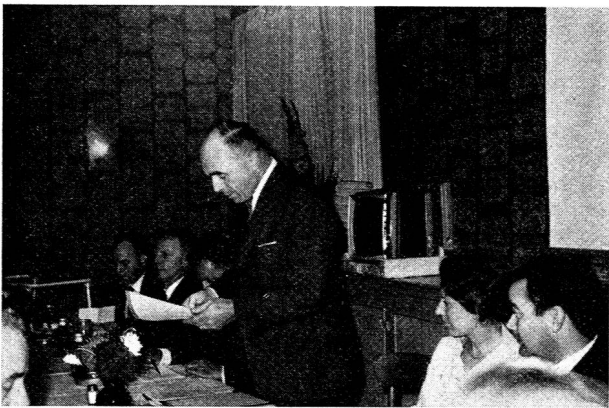
Offizielle Begrüßung der VST-Reisegruppe durch Präsident A. Zollinger im großen Saal des Hotels «Borchers»

Man darf annehmen, daß schon Monate vor dem geplanten Reiseternin in Kreisen unserer Mitglieder, Freunde und Gönner die 4. VST-Studienreise vielseitig kommentiert wurde. Wahrscheinlich wurden in Freundeskreisen manche Pläne geschmiedet, Wünsche und Anregungen zum Ausdruck gebracht, und was konnte man schon anderes machen, als auf weitere Vereinsnachrichten warten. Endlich erschien in unserem Vereinsorgan der wichtige Anmeldecoupon zur definitiven Teilnahme an der Studienreise. Nun hieß es die Anmeldung zeitgerecht abzusenden, den Reisebetrag umgehend zu überweisen,