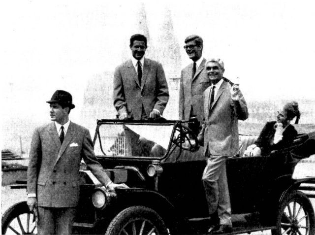
Vor der Kulisse des Kölner Doms, dem Wahrzeichen der rheinischen Metropole, demonstrierten diese Herren anlässlich der vergangenen Internationalen Herren-Mode-Woche den Anzugstil von 1965

Im Jahre 1954 wurde in Köln die erste Herren-Mode-Woche durchgeführt. Damals beteiligten sich 63 Aussteller. Im vergangenen Monat August, anlässlich der elften Veranstaltung, waren neben 298 deutschen Unternehmen, 141 Firmen aus 16 Ländern anwesend; die Ausstellungsfläche vergrößerte sich um das Fünffache und die Ausstellerzahl um das Siebenfache. 110 Unternehmen beschickten die diesjährige Bekleidungsmaschinenausstellung, und 1800 Fachleute, darunter 600 ausländische aus 19 Ländern, figurierten auf der Teilnehmerliste für die 9. Bekleidungstechnische Tagung, an welcher die Schweiz respektabel vertreten war.