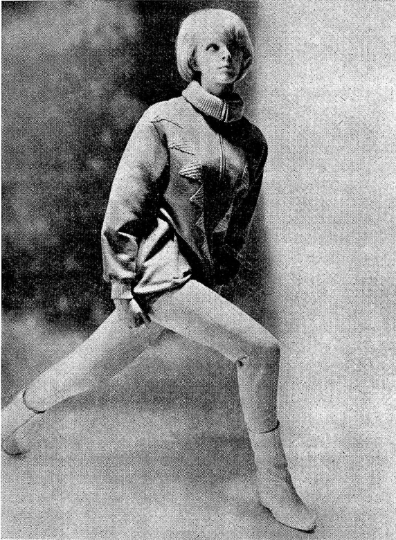
«Flaneur de Neige»

nierenden Wort, so dürfen andererseits die technischen Kreationen nicht unerwähnt bleiben. Als absolute Neuheit fand der «Tiefschneetaucher», ein in Hüfthöhe an die Skihose angenähter Pullover, reichen Beifall. Dieser Maillot-Dress dürfte bei den rassigen Skifahrern großen Anklang finden; er verhindert bei Stürzen, daß der kalte Schnee nicht durch alle Ritzen und Öffnungen bis auf die Haut eindringt. Zudem eignet sich der «Tiefschneetaucher» dank seinem Decolleté auch zum winterlichen