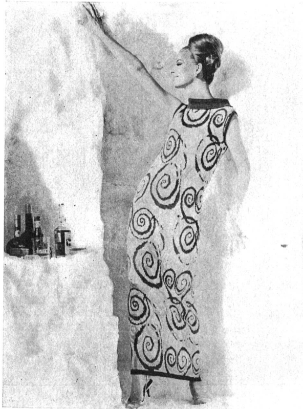
Langes Kleid für Après-Ski und Hotel Reine Wolle und Lurex Kollektion und Kreation: Tanner

Der bekannte Marketing-Spezialist Herbert Gross stellte kürzlich in einem vielbeachteten Referat vor führenden Textilindustriellen fest: «In der Textilindustrie werden die Aufgaben des Marketing steigende Kosten verursachen, die nicht immer vom einzelnen Betrieb getragen werden