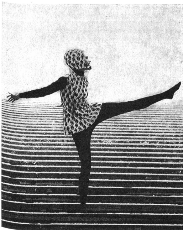
Schlittschuh-Ensemble Helanca-Set aus Nylon SVS, Tricot Jacquard Cloqué mit Stickerei Fabrikation, Kreation: Vollmoeller Stickerei: Union Marken: «Dorsuisse», «Helanca»

können, weshalb sich der textile Funktionsverbund als arbeitsteilige Kooperation in bestimmten Aufgaben nahelegt: etwa Vertriebsverbund, Werbeverbund, Forschungsverbund usw.» Im Swiss Fashion Club haben sich 18 Firmen zu einem Kreationsverbund zusammengeschlossen, der, auf das Technische übertragen, etwa mit einem Forschungsverbund verglichen werden könnte. Mitglieder dieser Verbundgemeinschaft sind: