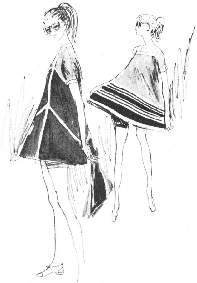
Trotz Minimode fördert das Trevira Studio International den Stoffkonsum. Die Trägerinnen haben sich vom «etwas längeren» Minijupe befreit und sichtbar sind die Bundhöschen aus dem gleichen Stoff

Dank diesen Ausführungen des Exportleiters der Farbwerke Hoechst AG stand die Trevira-Studio-Modenschau ausgesprochen unter dem Aspekt textilen Schaffens. Die vorgeführten Modelle waren ein Ausschnitt aus neuen Trevira-Gewebeentwicklungen , die in Struktur, Dessinierung und Farbnuancen auf die Moderichtung von Früh-