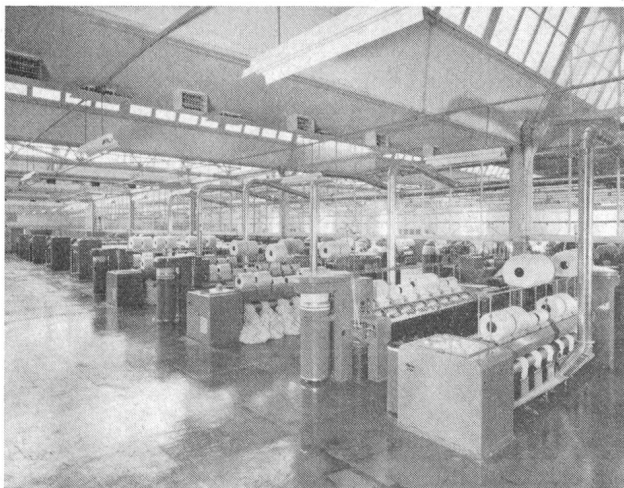
Kämmaschinen mit Abgangsabsaugung, im Hintergrund Strecken

Der Betrieb Aesch stellt mit seinen 34 000 Spindeln kardierte Garne Ne 12-44 (Nm 20-75) sowie gekämmte Garne Ne 30-120 (Nm 50-200) her. Bis zur Zeit der ITMA ist nun