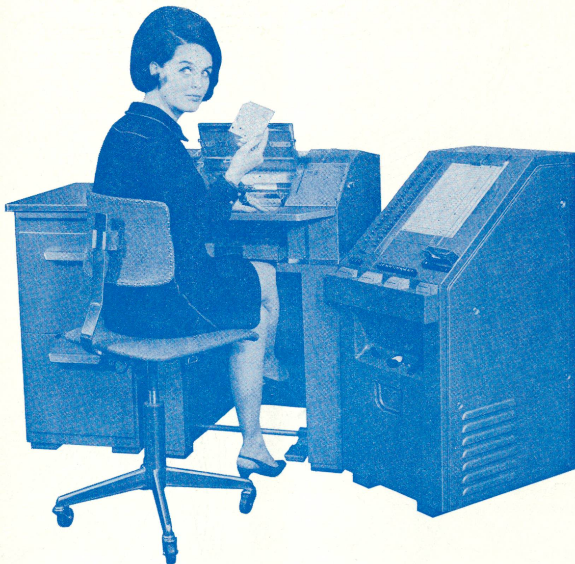
Modell Electronic 20 Modelle für jede Betriebsgröße und jeden Arbeitsanfall