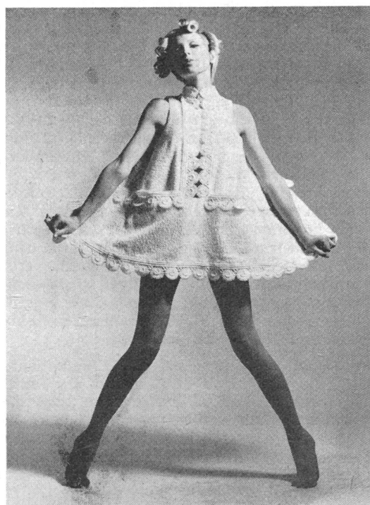
Das prämierte Strandensemble aus gelbem Frottierstoff mit Guipure der Modefachschule Arnhem

chem Material verfertigten «Fischerstiefeln» sich die Lorze beeren holte. Zum Schul- oder Bürodress verarbeitete London den mehrfarbigen Baumwolljacquard «en blais» zu einem Tablierrock mit kurzem Jäckchen und kombinierte eine Baumwoll-Truttorettebluse mit hochansteigendem Turtleneck dazu für das Topmodell. Mit einem gelben Baumwollpique-mantel und dem im Hemdchenstil geschmückten farbigen Handdruckkleid war Arnhem nochmal-