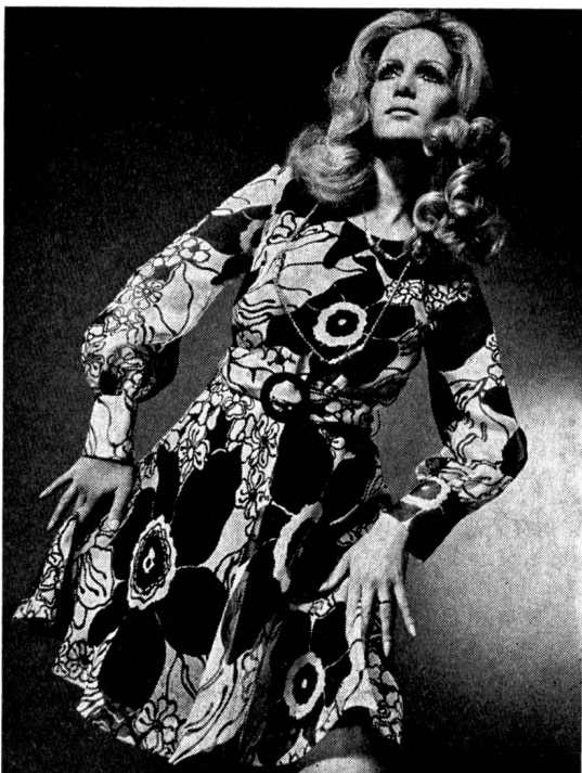
Beschwingtes Dinnerkleid aus bedrucktem Reinseiden-Chiffon Modell CORTESCA AG, Zürich

Szene immer wieder kleine anspruchslose Sommerkleider aus Crimplene, bedrucktem Baumwoll-Voile, texturierten Jerseys, synthetischen Chiffons, aus Leinenarten, Baumwollspitzen, Piqués — liebenswürdig praktisch, aber ohne besondere modische Aussagekraft und auch vom Material her nicht neu — vieles jedoch in sehr gepflegter Verarbeitung. Was gegen den Schluss dieses Défilés von Mantelfirmen des hohen Genres geboten wurde, war bester, ausgefeilter «Zürcher Stil». Außerst attraktive Phantasiewollstoffe und -Tweeds — etwa in neuartig proportionierten Karodessins (breiter als hoch) —, meist hellgründig in zwei bis drei abgetönten Farben spielend, kunstvoll desingerecht verarbeitet als Mantel-Complet, als Chanel-Kostüm, als Hosen-Ensemble, als klassischer Tailleur präsentiert. Sodann die kostbaren Uniquitäten: Effektkammgarne, Gabardine, Flanelle, elegante Doppelcrêpes, Leinenarten aus Fibrane oder reiner Seide — in den neuen, leicht antaillierten Schnittformen mit phantasievollen Nahtführungen zu makellos sitzenden Mänteln und Ensembles verarbeitet. Auch hier wieder deutlich erkennbare Handschriften bekannter Exportfirmen (neben sehr guten Leistungen weniger bekannter Häuser), die jede Saison mit kreativem Einsatz und grosszügiger Stoffauswahl für das Niveau und die Eigenart des «Zürcher Stils» eintreten.