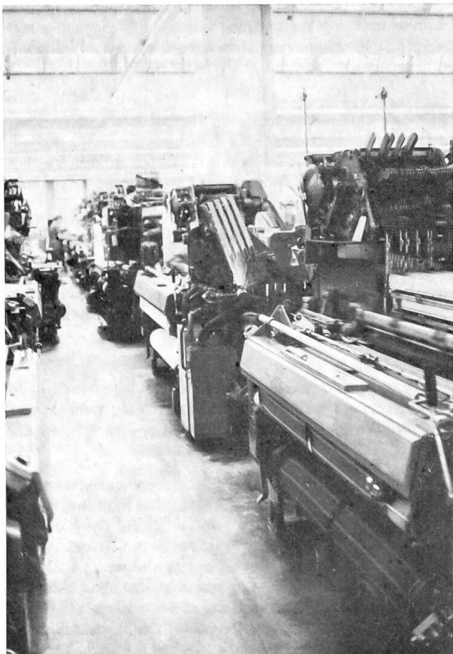
Spulenwechsel-Webmaschine Rütli, Typ C 1969, 4 Farben, 195 T/min, vollautomatischer Spulenwechsel