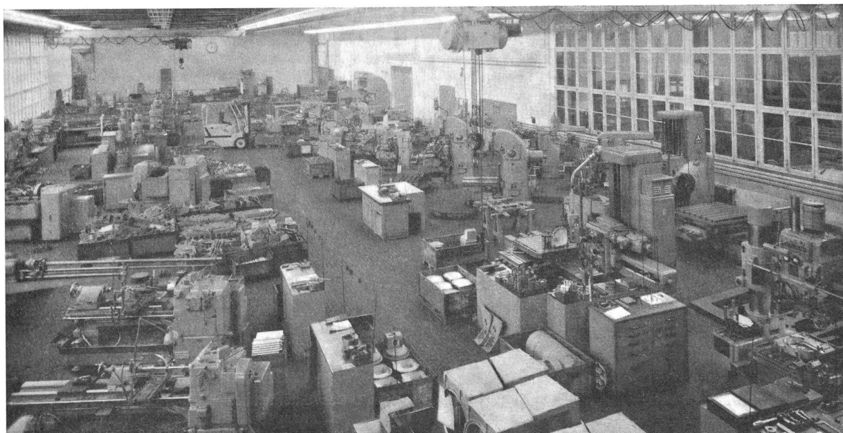
Die Maschinenbauabteilung wartet den Maschinenpark und hält den Betrieb auf dem Stand der neuesten technischen Entwicklung

Das spezifische Gewicht von Ramie beträgt 1,52–1,53 und lässt sich mit demjenigen von Leinen vergleichen. Die völlig degommierte Ramiefaser besteht praktisch zu 100% aus reiner Zellwolle. Ihre Reisslänge ist mit 61 km rund 8% höher als beim Flachs und beträgt rund das Doppelte der Baumwolle. Die Nassreissfestigkeit der Garne liegt etwa