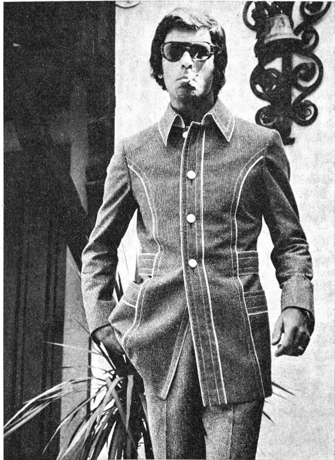
Hochmodischer Freizeitanzug mit kontrastfarbig abgepelten Kanten und Nähten. Taillenmarkierung durch seitlich eingearbeiteten Rückengurt. Material: Kammgarn TREVIRA mit 45 % reiner Schurwolle.

Wenn sich jetzt auch die Tagesmode wesentlich vergnügter präsentiert und auf echte Funktion Wert gelegt wird, so herrscht nach wie vor eine deutliche Trennung zwischen Tag und Freizeit. Für die Hobbystunden propagiert