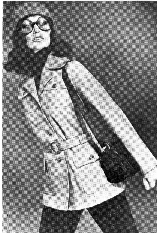
Sportlich-elegante Reversjacke aus weichem Wildleder. Création Suisse von UHU, Mode- und Sportbekleidung AG, Bern.

Während des 64. Jahreskongresses von Rotary International, der diesmal in Lausanne stattfand und rund 22 000 Besucher aus aller Welt in unser Land brachte, zeigten Schweizer Fabrikanten Mode für die Zukunft. Im grossen Theatersaal des Palais de Beaulieu präsentierten zwölf Mannequins und sechs Dressmen eine amüsant zusammengestellte, fröhlich getanzte Fashion-Show, in der alles zu sehen war, was im kommenden Herbst und Winter aktuell sein wird. Den Auftakt bildeten bunte Skianzüge in uni und gemustert, ergänzt durch glänzende Helme und farblich abgestimmte Schuhe. Anspruchsvolle Lederbekleidung, seien es nun Lammfellmäntel, hüftlange Safarijacken und Hosenanzüge aus Nappa oder Wildleder in verschiedenen Braun und hellen Modefarben, begeisterten