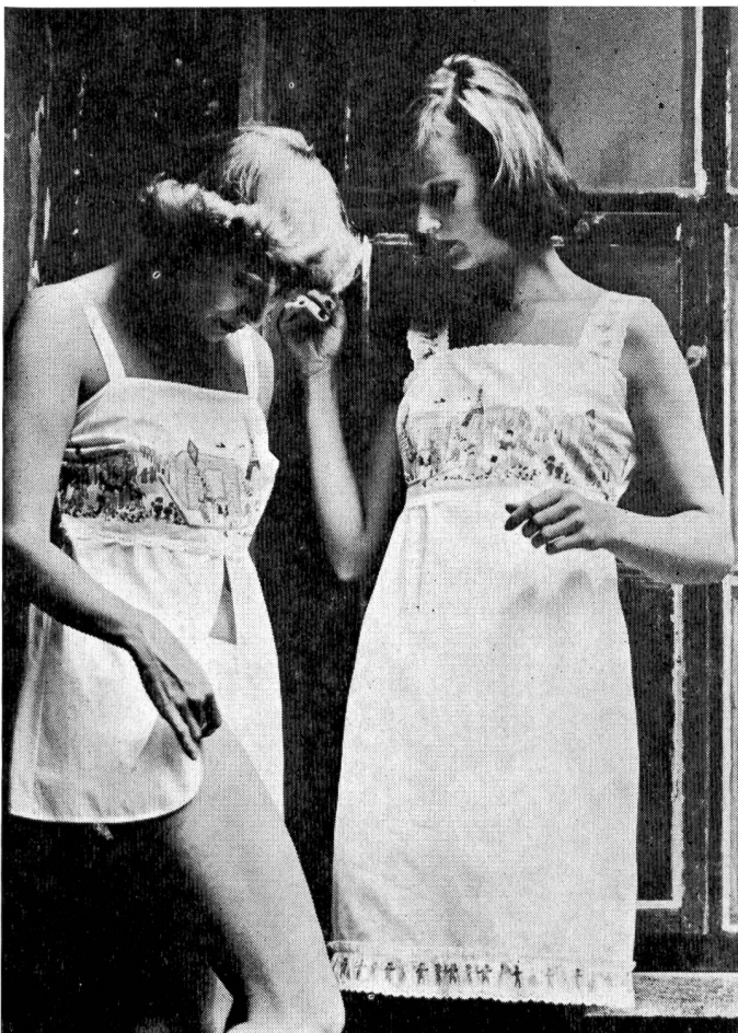
Bunte Motive aus dem Kinderbuch und feine Stickereibänder zieren das knappe Hemdchen – mit passendem Slip – und das Hängerchen aus weissem Baumwoll-Batist. Modelle Mylady – Stickerei Jacob Rohner.

Für feminine Eleganz sorgen die zahlreichen Modelle aus feinstem Baumwoll-Batist, Edelcrêpe oder transparentem Voile mit Spitzen an tiefen Décolletés, gerafften Büsten-teilen, schmalen Trägerchen und taillierenden Stickerei-