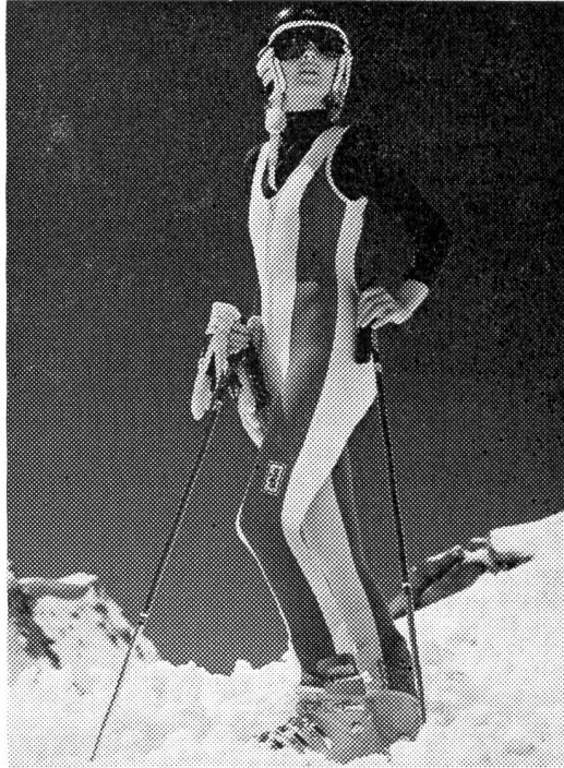
Hautnah ist diese elastische Nylsuisse-Skihose im Jumpsuit-Stil mit markanten Längseinsätzen und mit Schnallenfenstern. Modell: Skin AG, Aadorf; Foto: Andreas Gut, Zürich.

Auch bei den Schneeanzügen für Kinder überwiegen die hochgeschnittenen Ueberfallhosen, für die Kleinsten sind sie oft gar im Jumpsuit-Schnitt mit Achselverschluss gearbeitet. Die Jacken sind übertailleng und haben oft einen Strickbundabschluss. Viele Nylsuisse-Jackenmodelle lassen sich dabei auch als Schuljacke tragen und sind so fast ein wenig Mantel-Ersatz, was den Vorteil hat, dass das Kleidungsstück auch für Blitzwachsende voll ausgenutzt werden kann. Beliebt bei Mädchen und Buben sind Borgpelzkragen und -ausfütterung; und alle diese Modelle sind waschbar. Sowohl für die kleinsten wie auch für die grösseren Evastöchter sind dabei echt «feminine» Dessins und Farbkompositionen (wie bei den Grossen) erhältlich: getupft, geblumt, mit Jeans-Bordüren oder anderen modischen Applikationen versehen; hier oder dort kann man auch gedämpft leuchtenden Karo-Dessins begegnen. Bei den Knaben-Modellen herrschen breite Einsatzstreifen vor; begeistert sind Buben vor allem von Jacken und Zwei-