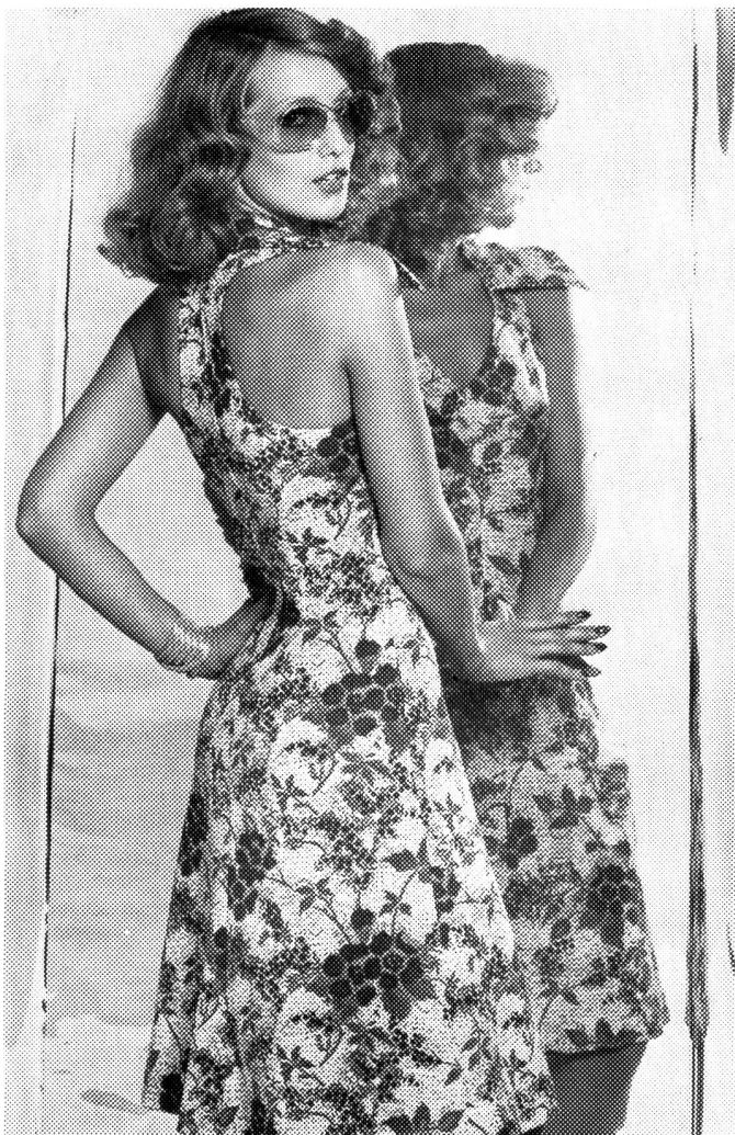
Zarte Grün-Nuancen zeigt dieses Tersuisse-Sommerkleid aus kofferfreundlichem Jersey — ein Modell, das sowohl mit einem dekorativen Rückendécolleté als auch mit einem attraktiven Kragen-Ausschnitt prunkt. Modell: Swisnit/Knechtli & Co., Zollikofen; Foto: Stephan Hanslin, Zürich.