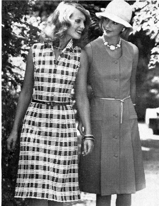
Zwei sommerliche Tersuisse-Kleider aus formstabilem Jersey. Links ein Modell im Polostil mit Vorderreissverschluss und schmalen Gürtel; rechts ein unifarbenes, durchgeknöpftes Kleid mit kleinem U-Décolleté, mit oder ohne Gürtel tragbar. Beide Modelle sind bis Grösse 46 erhältlich. Modelle: Franz Heusser AG, Zürich; Foto: Stephan Hanslin, Zürich.

Mini-kurz gehört denn auch in der Tat der Vergangenheit an — und die Jeanswelle dazu! Vom Schnitt und von der Proportion her betrachtet, so fand man inzwischen wieder, kleidet eine Ueberknielänge Frauen besser. Wobei in diesem Frühling die Längen-Massstäbe individuell auf die