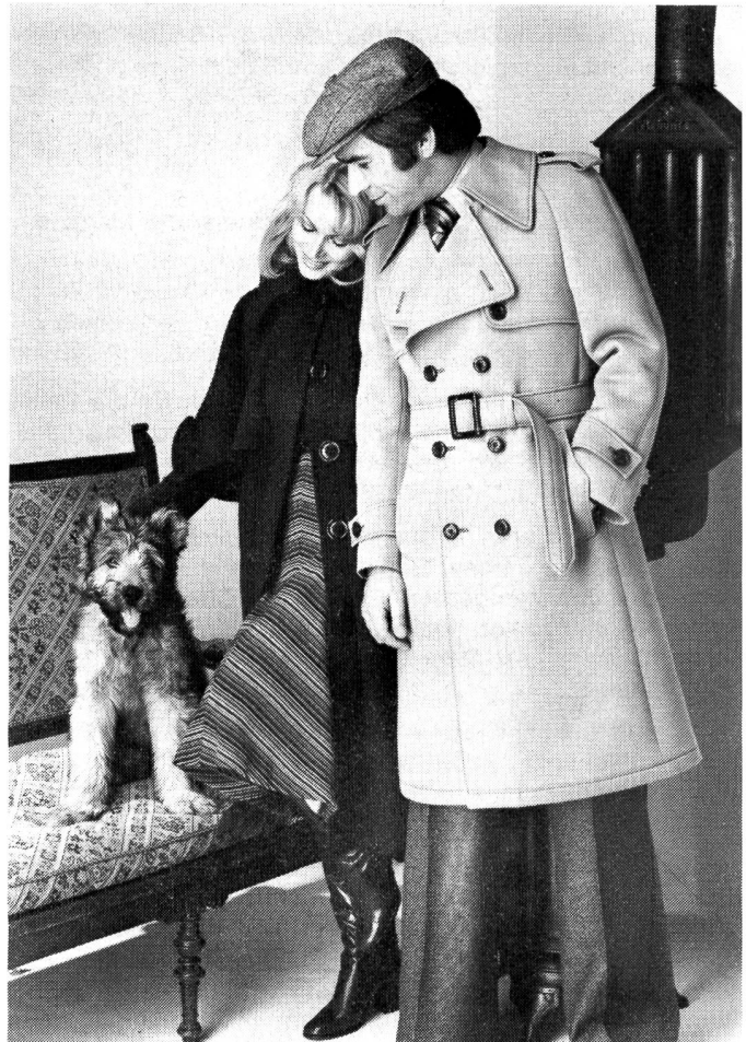
Trenchcoatartiges Mantelmodell mit markantem Kragen und Gurt. Dekorative Ziernähte geben dem Manel im Raglanschnitt die jugendliche Note (Ritex of Switzerland).

C-Mäntel, als sportlich-jugendliche Modelle (Pullover-Mantel, kurze und lange Form): Trench-Country 109 cm