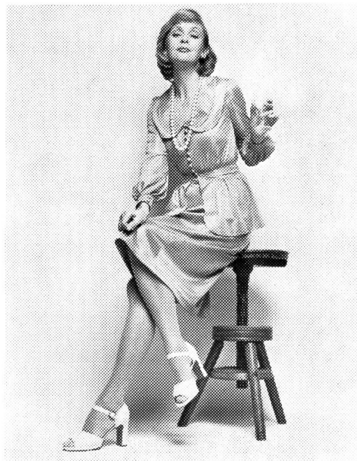
Ein «petit costume» in Cyclamen-Rose — ein Tersuisse-Modell mit eingearbeiteter Taillenpatte, wippendem Schösschen und mit sanft schrägeschnittenem Vierbahnen-Jupe. (Das Modell ist auch in Silbergrau oder in Lavendel erhältlich.) Modell: Rena AG, Zürich; Foto: Andreas Gut, Zürich.