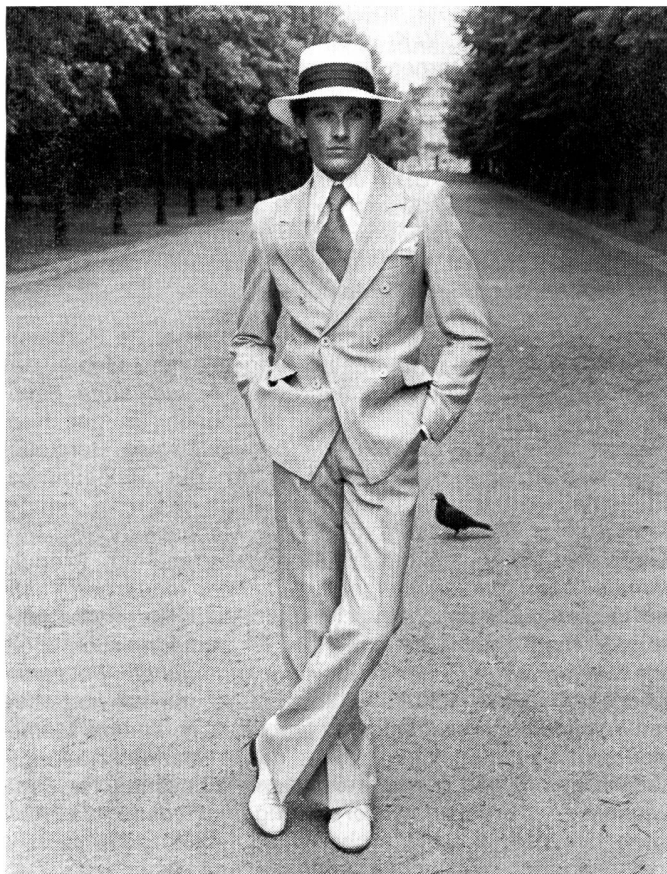
Eleganter Stadtanzug aus extraleichtem, hellgrauem Wollsiegel-Gewebe mit feinen hellen Streifen. Zweireihiger Sakko mit drei Knopfpaaren in Deichselanordnung, glattem Rücken ohne Schlitz und Ziersteppung der Kanten. Bundfaltenhose ohne Aufschlag. Wollsiegel-Modell: Bausch, Otzenrath; Foto: Wollsiegel-Dienst, Stock.