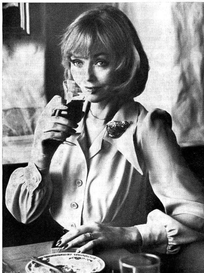
Aus duftigem, nichttransparentem Voile ist diese zartfarbene, mintgrüne Tersuisse-Bluse gearbeitet. Ihre besonderen Akzente: halsferner, langschenkliger Reverskragen und weite Hemdblusenärmel. Modell: H. W. Giger AG, Flawil; Foto: Stephan Hanslin, Zürich.