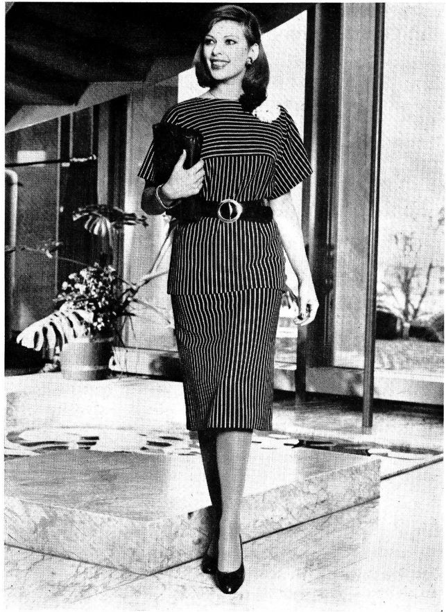
Deutlich akzentuiert ist die T-Linie beim Kasak-Deux-pièces aus schwarz-weiss gestreiftem Synthetic-Jersey mit Seidentoucher. Cortesca AG, Zürich.

Die aktuelle T-Linie — mit verbreiterten, geraden Schultern und tief angesetzten oder angeschnittenen Ärmeln — lässt auch grosse Grössen schlank erscheinen. Wichtig dabei ist, dass Oberteile leicht blusig, die Jupepartien schmal und trotzdem beschwingt gearbeitet sind. Selbstverständlich bleibt das Knie bedeckt, doch wo der Saum endet, hängt von der Proportion und Grösse der Trägerin ab: Kleingewachsene Frauen wählen mit Vorteil knapp kniebedeckend, grössere bis zur Wadenmitte reichend.