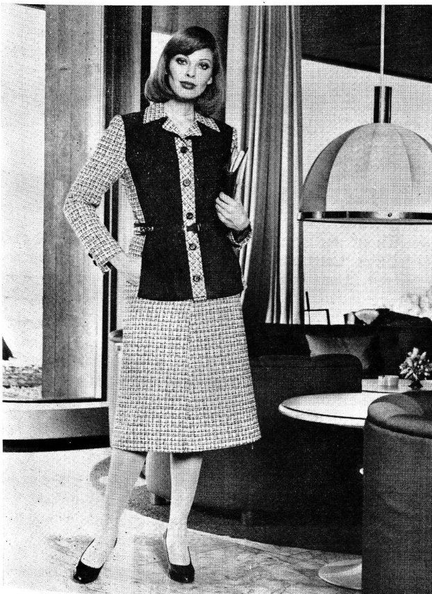
Ein Kostüm, das sich mit oder ohne Bluse tragen lässt, aus blau-weissem, feinem Tweed mit Wildledervorderteil. Algo AG, Zürich.

Schweizermode und anspruchsvolle Qualität — diese Begriffe gewinnen in unserer, durch die Rezession geprägten Zeit wieder an Aktualität. Man kauft nicht mehr unbesonnen ein Kleidungsstück, weil es hübsch und billig ist, man beginnt wieder zu überlegen, was man wirklich braucht, nämlich eine vielseitig variable Garderobe, die nur aus wenigen Kleidungsstücken zu bestehen braucht. Doch die Auswahl dafür sollte man sorgfältig planen. Diese Gedanken haben sich auch unsere Fabrikanten zu Herzen genommen und bieten Mode, die manche Saison, natürlich aufgefrischt durch aktuelle Dessins und Details, überdauern dürfte. Der neue, klassisch-elegante Stil lässt sich individuell interpretieren, einmal streng oder feminin aufgelockert. Beim Zusammenstellen sollte man sich auf eine Grundfarbe konzentrieren, sei es Schwarz, Marine, Braun oder Grau, um dann mit leuchtenden Rot, hellen Gelb, Grün, Flieder oder Türkis interessant aufzufrischen.