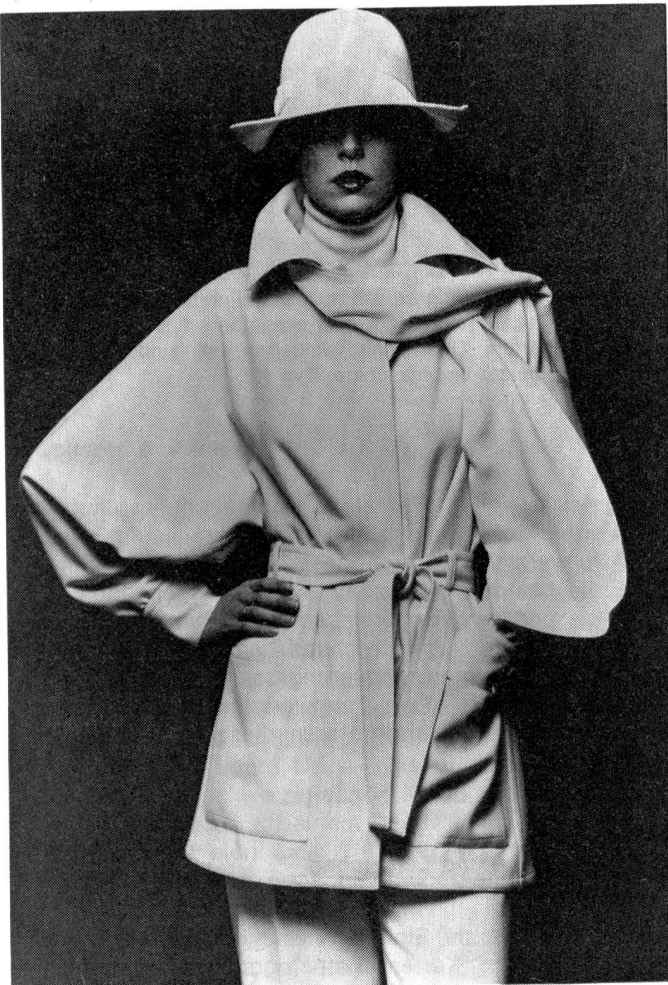
Jean-Louis Scherrer entwarf dieses Ensemble aus weissem Schurwoll-Flanell von Dormeuil. Die Jacke zeigt weite Fledermaus-Aermel. Die Hose wird zu den Knöcheln hin enger und endet in breiten Aufschlägen. Modell: Jean-Louis Scherrer; Foto: Wollsiegel-Dienst.

wird der Abend immer mehr zur eigentlichen Domäne der Haute Couture — hier kann sie bezaubern, brillieren — luxuriös und unnachahmlich.