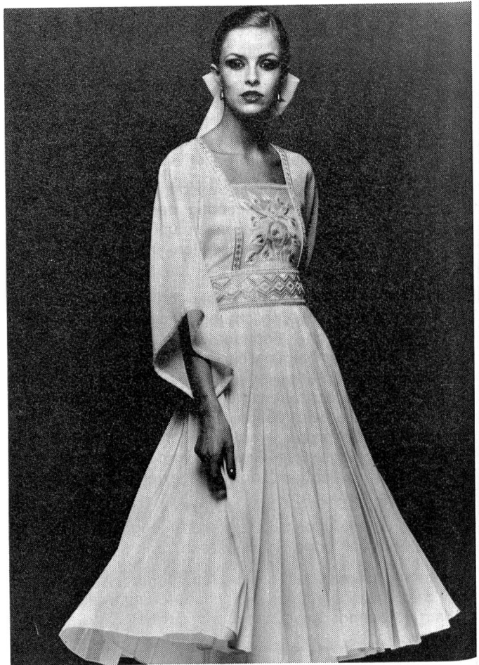
Von Ricci stammt dieses kurze Abendkleid aus naturfarbenem Schurwoll-Voile von Fournir. Weisse und goldfarbene Stickerereien zieren das Vorderteil und den breiten Gürtel. Modell: Ricci; Foto: Wollsiegel-Dienst.

Uebrigens, nicht nur bei St. Laurent, sondern auch in den meisten anderen Salons in Rom und Paris waren ca. 80% der Kollektionen den festlichen Anlässen gewidmet. So