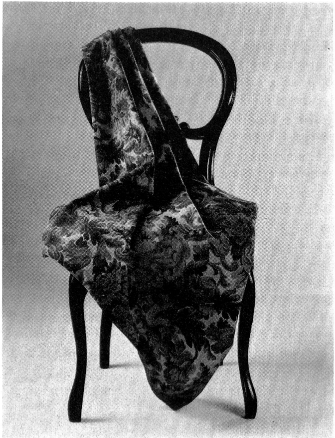
Neuentwickelter Tersuisse-Polsterbezugsstoff.

Als wichtige Artikel im Sektor der Heimtextilien gelten die zur Fensterverkleidung gebräuchlichen Gardinen, Raschelgardinen, Voilegewebe, Marquissette- und modischen Ausbrennstoffe. Für die Herstellung solcher Stoffe werden heute fast ausschliesslich glatte oder texturierte Polyester-Filamentgarne, beispielsweise Tersuisse-Garne, im Titerbereich 50—167 dtex eingesetzt. Die Dessinierung dieser Qualitäten ist mannigfach, man findet florale,