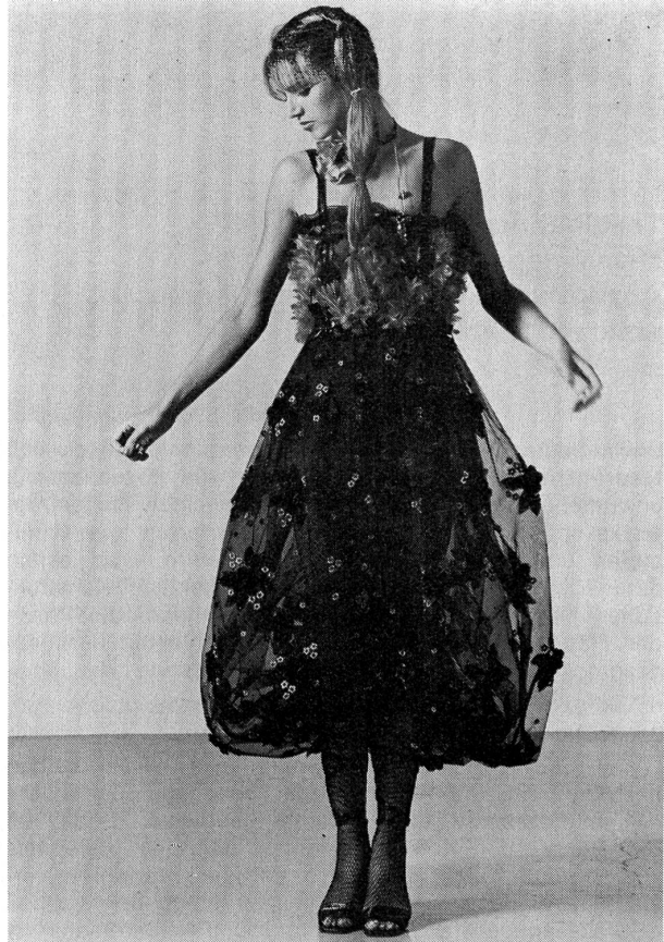
Broderie en viscose rose et lurex chenille noir sur tulle noir avec application de fleurs en velours noir. Création: André Courrèges, Paris; Broderie: Jakob Schlaepfer, St-Gall; Photo: Peter Knapp, Paris.

Selten eine Saison, in der die Abendmode sich so eigenständig präsentiert hat, wie eben diesen Herbst, selten auch die Vielfalt an Modellen, die vom einfachen «Kleinen Schwarzen» über avantgardistische «Sexy-Disco-Glamour-Look»-Modeideen bis hin zur perfekten Eleganz kostbarer Brokatroben reicht. Wer sich in dieses Abenteuer stürzt, wird die Qual der Wahl erfahren, wird dann aber reich entschädigt durch eine rauschende Ballnacht, zu der nicht zuletzt das Kleid beigetragen hat.