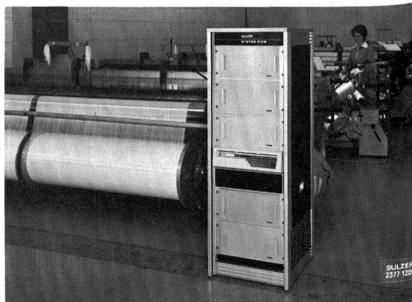
Neues computergesteuertes System 913-M zur automatischen Erfassung und Verarbeitung von Produktionsdaten für kleinere und mittlere Unternehmen der Textilindustrie.