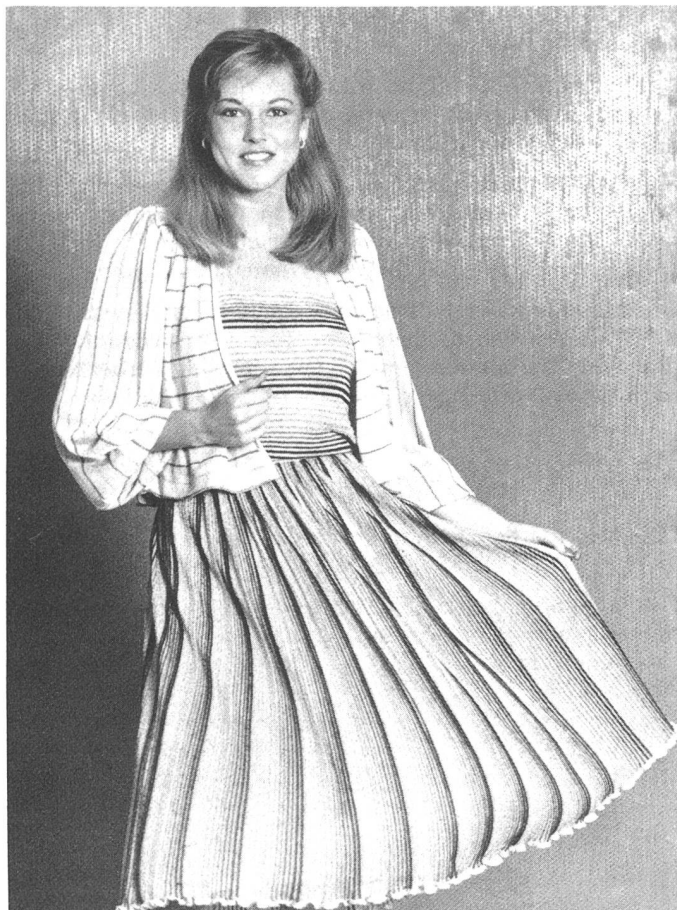
Bel completo tre pezzi con tre tipi diversi di rigature. Bolero con spalle in evidenza (Dorex)

Stoffen und bei den Kontrasten glänzend/matt, die in einigen Fällen die gestreiften Muster charakterisieren.