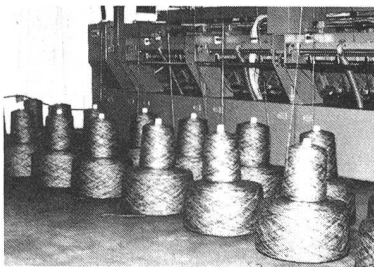
Zuführen des Garnes ab Konen, Kuchen oder ab Dämpfanlage in die Wickelmaschine

Wir bauen modernste Hochleistungs-Anlagen für das Wickeln und Banderolieren sowie Verpacken von Handstrickgarn-Knäueln und Rollstrangen