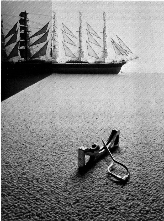
Ein Traum aus reiner Schurwolle: Alpina-Tyros, der neue grobknopfige Tufting-Teppichboden im Berberstil für gehobene Ansprüche.

Alle drei Artikel tragen das IWS-Siegel, sind im Wohnbereich mit Treppeneignung eingestuft und können ohne weiteres auch in Räumen mit Fussbodenheizungen verlegt werden.