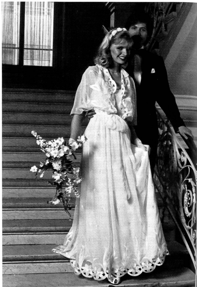
Brautmode Sommer 1981 – Ganz in Weiss/Blanc virginal pour les mariées de l'été 1981

Modell/modèle: Nuxial-Spose, Torino/Italia