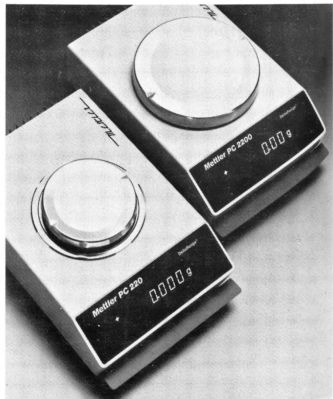
Mettler PC220/PC2200 Elektronische Präzisionswaagen mit Mettler DeltaRange.

An Wägebereichen, die keinen sehr breiten Gewichtsreich bestreichen, dafür innerhalb eines besonders limitierten Budgetrahmens zu erfüllen sind, hat Mettler bei