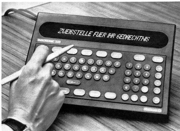
Telefonzentrale, Nachrichtensender, Rechenzentrum, Terminplaner in einem Kleincomputer für Fr. 1850. —

automatisch. Konferenzen können zeitlich mit einer Countdown-Wählung kontrolliert werden. Beim Erreichen des Nullpunktes ertönt ein anhaltender Summton. Der Variotronic 700 enthält auch eine Kalenderuhr, eine Weltzeitstation, die bis zu zehn Weltzeitzonen speichert sowie eine Stopuhr. Für unbefugte sperrt ein Code-System den Zugriff automatisch. Die Bedienung dieses Schreibtischcomputers, in einem hochaparten Design gestaltet, ist ganz einfach. Die Beratung und der Vertrieb erfolgen durch den Bürofachhandel.