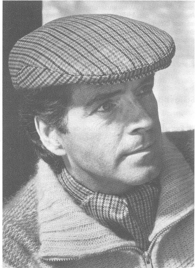
Einteilige Mütze, Alpaca-Schurwolle Fürst AG Wädenswil, Sport & Mode

Unsere einheimischen Huterer präsentieren eine sportlich inspirierte Mode in gepflegter Ausführung. Das aktuelle Bild für den kommenden Winter: rassige Travelerformen als Allroundmodelle für aktive Männer, in dezenten Dessins aufgemacht; sportliche Globetrotter-Hüte aus wertvollen Stoffen, mit einseitig gehefteter Falte; robuste Jäger- oder Grenzer-Hüte aus imprägniertem Wollfilz; abenteuerliche Sombreros und Reagan-Modelle aus solider Filzqualität; klassische Dreispitz-Trenkerhüte für Individualisten... und dazu ein abwechslungsreiches Mützenangebot für (fast) alle Ansprüche!