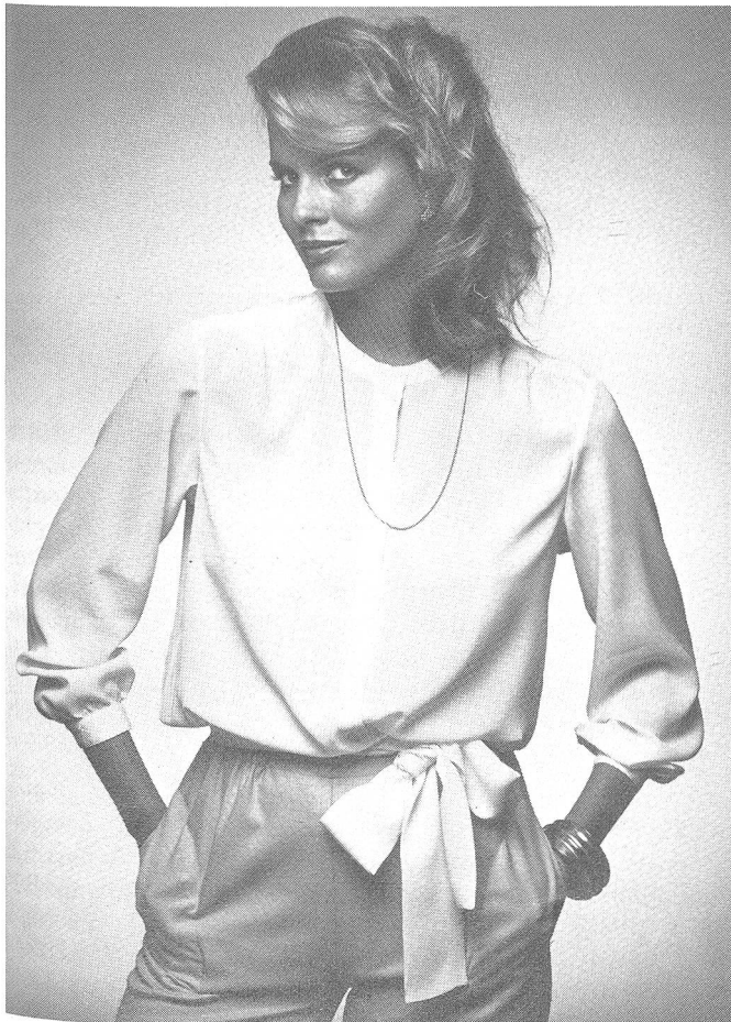
Salopp-elegante Tersuisse-Bluse aus hautfreundlichem und bügelarmem Georgette mit verdecktem Knopfverschluss, schmalen Hals- und Schulter-Blenden sowie angenähter Gürtel-Schärpe.

TOP QUALITY SWISS MADE – dafür gebührt den Schweizer Hut- und Mützenherstellern volle Anerkennung.