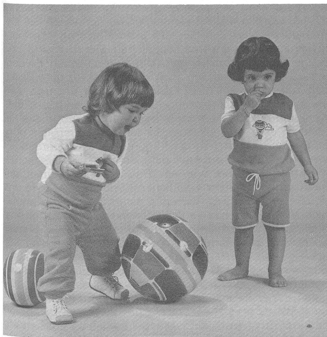
Bébé-jou®. Zwei-Teiler aus der Modellgruppe BALLON Links ein Zwei-Teiler aus Molton-Jersey, 100% Baumwolle, in den Farben pink und aqua. Rechts ein Zwei-Teiler aus 100% Baumwoll-Interlock, in den Farben pink und aqua

Modelle bébé-jou, mit Qualitätsgarantie. Atelier 49 AG, CH-8957 Spreitenbach/Schweiz