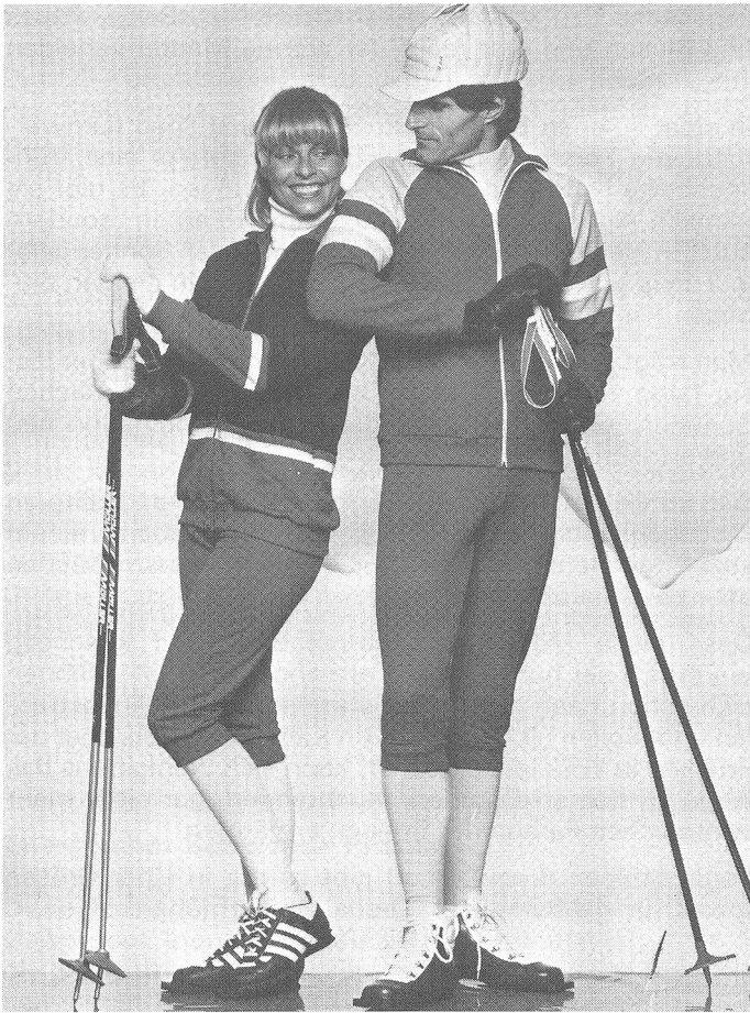
Zwei atmungsaktive und temperatenausgleichende Nylsuisse-Langlaufanzüge in Lackrot mit Baumwollabseite, für den Herrn mit grauen und weissen Einsätzen, für die Dame mit marine und weissen Kontrastpartien. Die zweiteiligen Modelle werden von hochgeschnittenen, die Nierenpartie schützenden Hosen begleitet. Modelle: Merboso AG, CH-8902 Urdorf Mütze: Fürst AG, CH-8820 Wädenswil