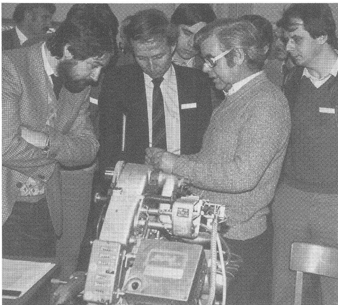
Mit grossem Interesse verfolgten Kursbesucher die Erklärungen eines Fachmannes über das «Spleissen».