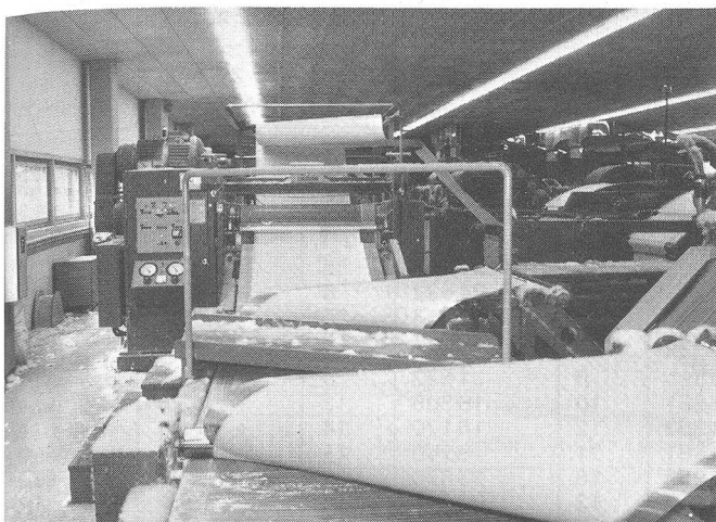
Der Faserflor wird zu einem Wattevlies zusammengefasst

Anteil der von inländischen Spinnereien und Händlern bezogenen Kämmlinge etwa 50 Prozent beträgt, die andere Hälfte wird über den Rohbaumwollhandel bezogen. Es überwiegen Provenienzen aus den USA, Peru und Pakistan. Pakistanische Baumwolle wird aus produktionstechnischen und Preisgründen für die Erzeugung eines Spezialartikels, der Milchfilter, benötigt. Bei dieser haus-eigenen Entwicklung, die in der Landwirtschaft bzw. den Milchgenossenschaften in grossen Mengen eingesetzt wird, nimmt die Flawa als einziger inländischer Produzent dieser Spezies eine Sonderstellung ein. Zellwolle wird unter anderem als Beimischung zu Baumwollkämmlingen (zur Stabilisierung der kurzen Fasern) für Watteprodukte verwendet. Zickzackwatte kann in unteren Preisklassen zu 100 Prozent aus zellulosischen Fasern bestehen; Watte erster Qualität dagegen ist nach wie vor aus 100 Prozent Baumwolle.