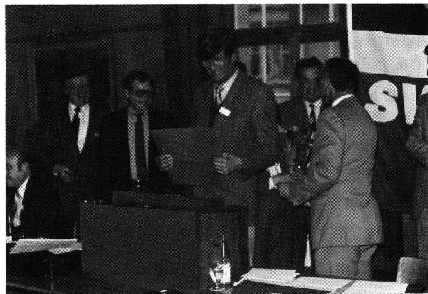
Veteranen-Ehrung durch den SVT-Präsident Xaver Brügger