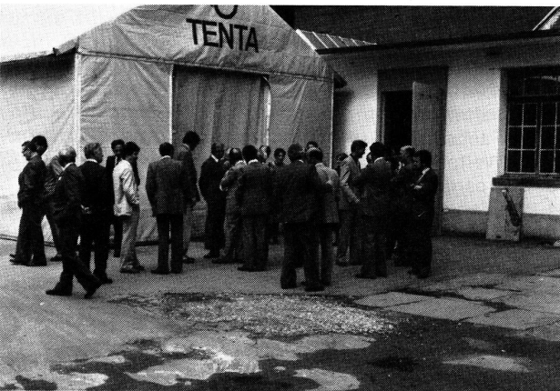
Firma Geiser AG, Tentawerke, Hasle-Rüegsau