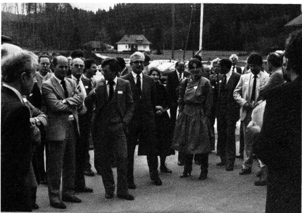
Firma Geissbühler & Co. AG, Lützelflüh