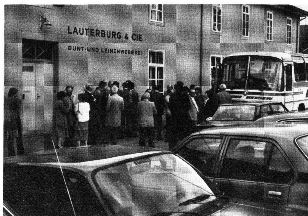
Firma Lauterburg & Cie. AG, Bärau/Langnau i.E.

Schon um 13.00 Uhr versammelten sich die an der GV teilnehmenden Mitglieder unterhalb des Schlosses Burgdorf, wo sie per Car zu Besichtigungen abgeholt wurden. Eine Gruppe besuchte die Firma Lauterburg & Cie. AG, in Langnau, das Heimatmuseum Langnau sowie die Firma Sängler-Leinen AG in Langnau. Einer zweiten Gruppe war Gelegenheit geboten, die Firma Geiser AG, Tentawerke, Hasle-Rüegsau und die Firma Geissbühler & Co. AG, Lützelflüh, zu besichtigen. Die leistungsfähigen Betriebe im Bernbiet, die sich besonders durch einen grossen Spezialitätencharakter ausweisen können, hinterliessen bei den Teilnehmern einen nachhaltenden Eindruck. Frühzeitig wurden die Mitglieder nach Burgdorf zurückgebracht, so dass die Generalversammlung pünktlich beginnen konnte.