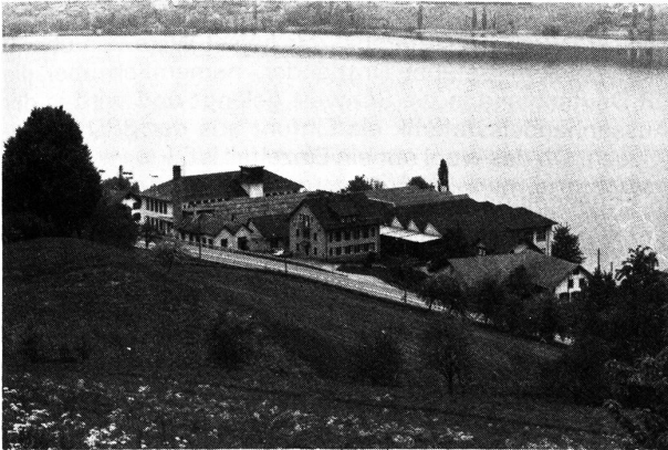
Der Webereikomplex liegt oberhalb des Hallwilersees

Fährt man von Lenzburg her kommend entlang dem Trasse der Seetalbahn in Richtung Luzern, so stösst man etwa auf der halben Länge des Hallwilersees in leicht erhöhter Aussichtslage ziemlich überraschend linker Hand der Kantonsstrasse auf einen Fabrikkomplex – an einem Ort, wo sonst eher Villen vermutet werden. Hier im Flecken Birrwil stehen seit wenigen Wochen die neuesten Sulzer-Projektwebmaschinen in Betrieb, in einer Weberei, die heute ausschliesslich mit Sulzer-Einheiten bestückt ist.