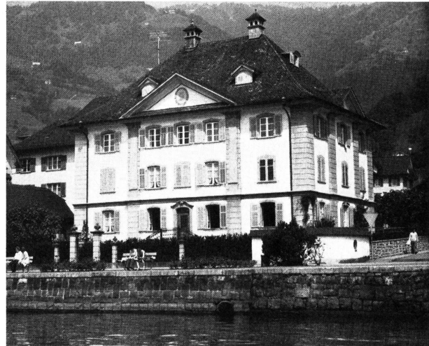
In diesem schönen, Ende des 18. Jahrhunderts errichteten Gebäude, genannt «Minerva», befinden sich Verwaltung und Geschäftsleitung

Nähert man sich, von Brunnen her kommend, über die Kantonsstrasse Gersau, so ist, rechter Hand und für jeden Besucher unübersehbar, unmittelbar neben der Kirche das Haus «Minerva», ein schöner klassizistischer Bau als Dominante des Dorfbildes im Mittelpunkt des Blickwinkels. Hier an einem Ort, der ausserhalb der Textilbranche in erster Linie mit dem Begriff Fremdenverkehr in Zusammenhang gebracht wird, befindet sich Sitz und Produktionsstätte der Schappe- und Cordonnetspinnerei Camenzind + Co.