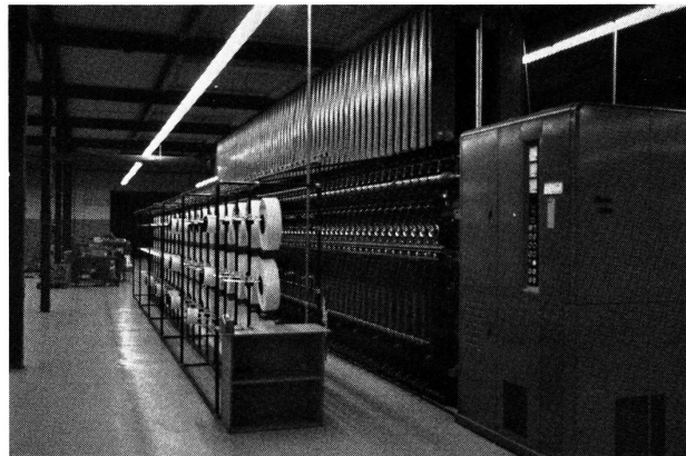
Texturiermaschine in Zusammenarbeit mit der Firma Rieter entwickelt und gebaut, läuft bis 1000 Meter je Minute.