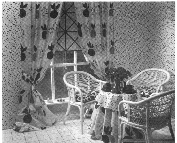
Fensterkleid aus bedrucktem Baumwoll-Chintz – 130 cm Vorhang und Tisch Tuch mit Schmetterling-Motiv Chintz 15851/10 (weissfond) Rollo Chintz 15853/10 Wandbespannung Chintz 15852/10 Kissenbezug Chintz 15854/10

«Sonnenfilter heisst die letzte Gruppe von attraktiven Transparenten, die in Farbe einen besonders modischen Aspekt ergeben.