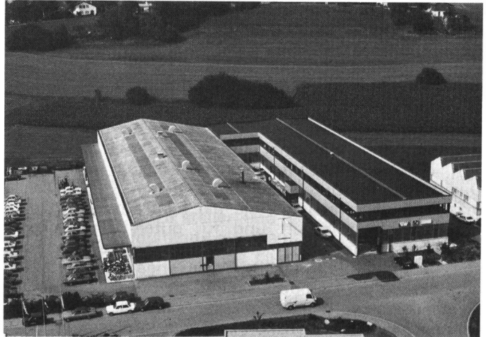
Flugaufnahme des Firmensitzes in Wetzikon

Die Kurzform G + W dürfte jedem Kammgarnspinner und im Speziellen den Repräsentanten des Handstrickgarnsektors ein Begriff sein, die beiden Grossbuchstaben stehen für die früher verwendete Firmenbezeichnung Günther + Walker. Das Unternehmen begann vor etwas mehr als 35 Jahren mit dem Werkzeugbau, sowie der Erzeugung von Maschinen für die Schokoladenindustrie. Sehr bald gesellten sich Verpackungsmaschinen hinzu. 1965 wurde die Waagen-Herstellerin Max Keller AG übernommen und Ende der sechziger Jahre schliesslich startete man im Textilmaschinenbau, genauer mit der Herstellung von Knäuelwickelmaschinen für die Wollindustrie. Damals zeichnete sich der Übergang in der Endaufmachung von den herkömmlichen Strangen zu Handstrickgarn-Rundknäueln ab, die entsprechende Entwicklungen in der Textilmaschinenproduktion erforderten.