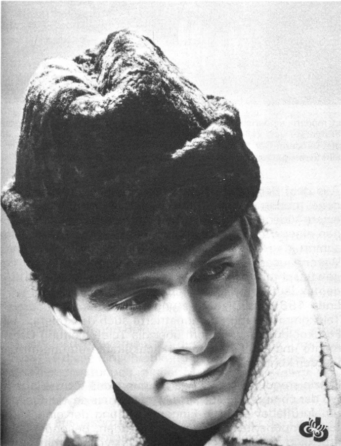
Herren Toque echt Gotland Lamm, Modell 790 Carmen Bieri Mauren

Weich und leicht verarbeitete Traveller- und Globetrotter-Formen sind aus wertvollen Materialien wie Cashmere, Mohair, feinste Lambswool, Alcantara oder Leder gearbeitet. Dazu kombinierte Long-Shawls wirken besonders attraktiv.