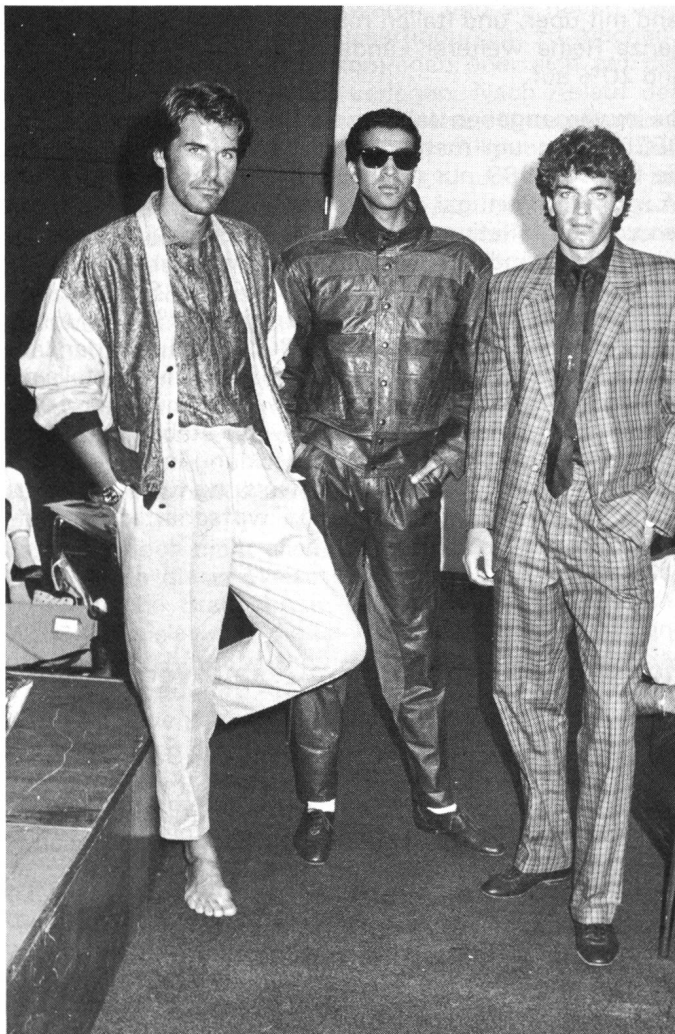
Kölner Modegespräch mit britischen Designern

Leitmotiv für die 90er Jahre: Individualität