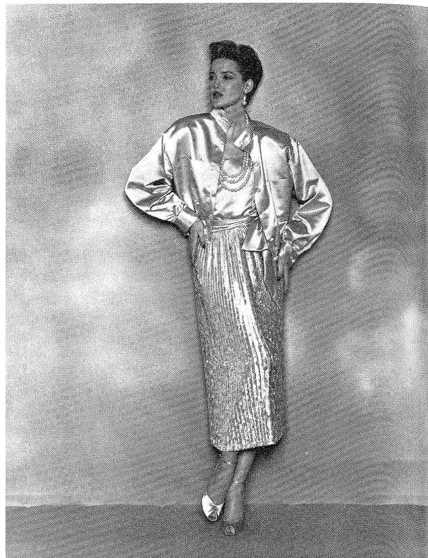
Guy Laroche Haute Diffusion, Style Guy Douvier, Paris Herbst/Winter 1985/86