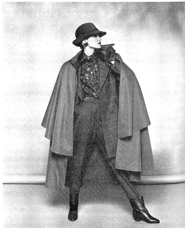
Guy Laroche Haute Diffusion, Style Guy Douvier, Paris Herbst/Winter 1985/86