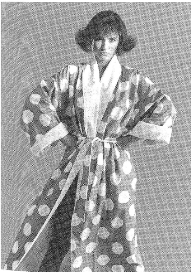
Sportlich-eleganter Wickelmantel: Aussenseite Baumwolledruck mit Tupfen-Dessin (Webware), Innenseite feiner Baumwolle-Frotté. Qualität: 100% Baumwolle.