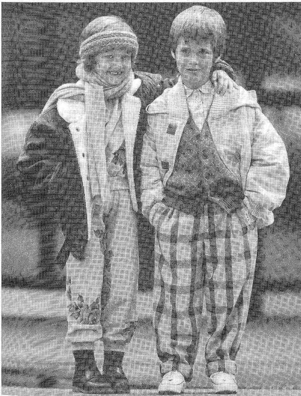
Mädchen: Koutsikou-Jeansjacke, mit Borgfutter, Portobellos-Strickweste, Koutsikou-Trainingsanzug, 2teilig, mit Blumenmuster. Knabe: Karohose Portobellos, Kapuzenjacke Portobellos, Strickjacke Portobellos, Baumwoll-Hemd Portobellos.